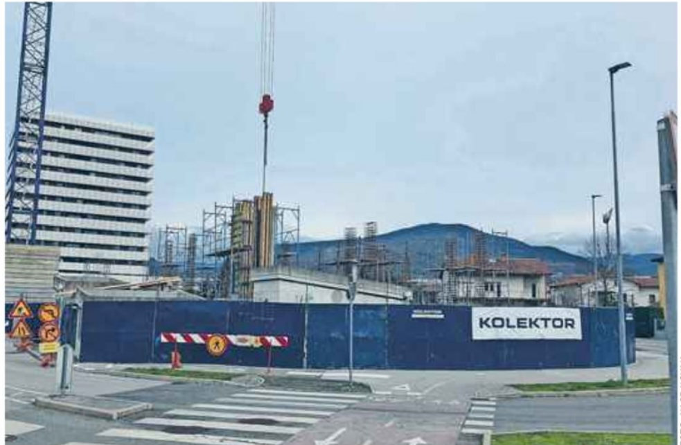
Po Cedri in Tisi bo predvidoma do konca leta 2025 na Majskih poljanah stala še stolpnica Pinja, v kateri naj bi bilo 72 stanovanj vseljivih v letu 2026.

evrov na kvadratni meter bruto z DDV bo treba v povprečju odšteti za stanovanja v stolpnici Pinja in poslovnem in stanovanjskem objektu Nica